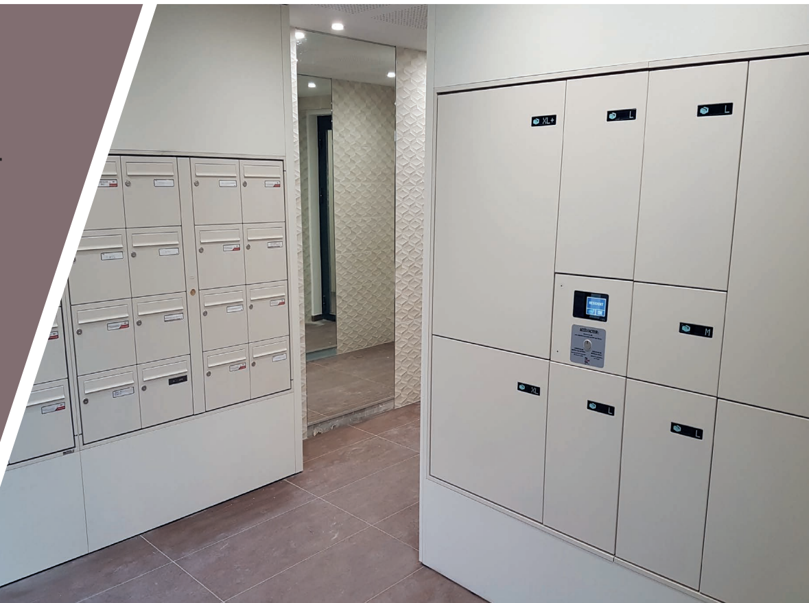
Hall des Loges, Résidence IMAPRIM à Ferney-Voltaire, lauréat Pyramide d'Argent de la FPI Alpes