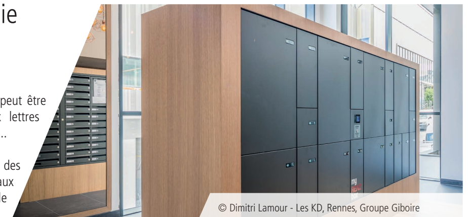
© Dimitri Lamour - Les KD, Rennes, Groupe Giboire

La sobriété des portes FLat, des habillages, des coloris et des décors assortis à ceux des boîtes aux lettres garantiront une intégration architecturale harmonieuse.