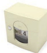
1 porte compact (voir p 91) (285 x 285 x 165 mm)