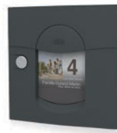
gris anthracite mat sablé REN 0206MS