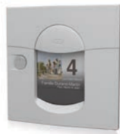
gris clair mat sablé REN 0205MS