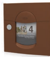
rouille mat sablé REN 0210MS