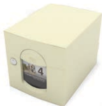
1 porte (285 x 285 x 400 mm)

porte-nom personnalisable sur www.boitesauxlettres.fr