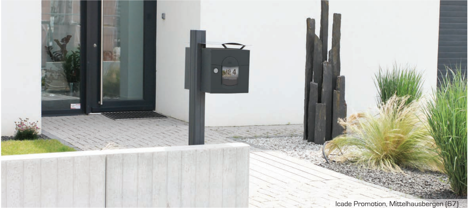
Icade Promotion, Mittelhausbergen (67)