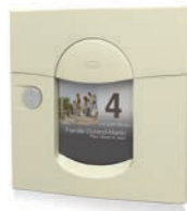
ton pierre mat sablé RAL 1013MS