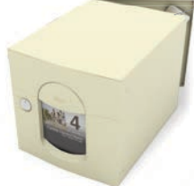
2 portes (285 x 285 x 415 mm)