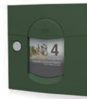
vert bouteille mat sablé RAL 6007MS