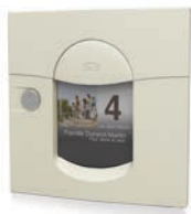
blanc crème mat sablé RAL 9010MS