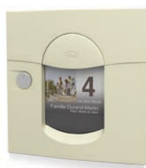
ton pierre mat sablé RAL 1013MS