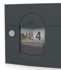
gris anthracite mat sablé REN 0206MS