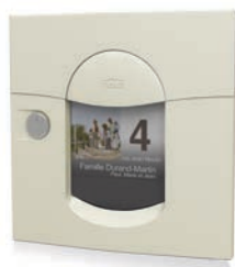
blanc crème mat sablé RAL 9010MS